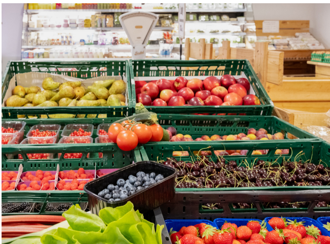
Veel boeren combineren hun agrarische bedrijfsvoering met bijvoorbeeld eigen verkoop van producten. Hier te zien bij een boerderijwinkel in Midden-Limburg.