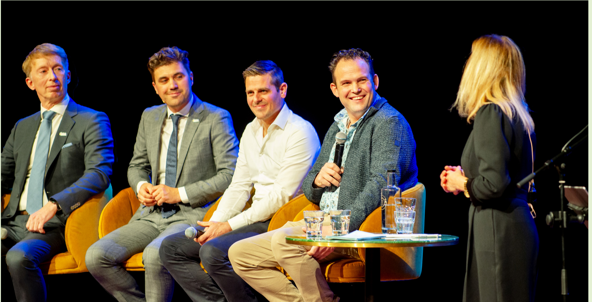
Jaarcongres 2025: Directeur, voorzitter en jonge ondernemers in gesprek over de strategische koers van de LLTB.

In de LLTB Resultatenkrant kijken we elk voorjaar terug op wat we het afgelopen jaar voor onze leden hebben gedaan en bereikt. Dat doen we op het gebied van onze eigen projecten, we blikken terug op wat er in de drie regio's heeft gespeeld en we laten zien wat er in LTO-verband sectoraal, nationaal en internationaal is behaald.