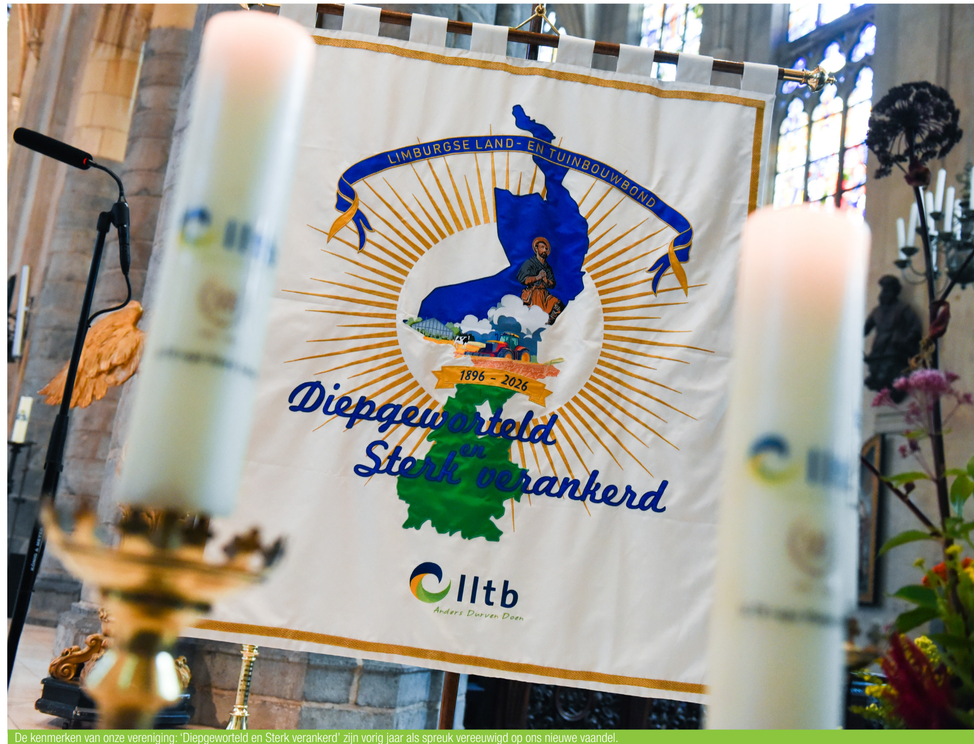
De kenmerken van onze vereniging: 'Diepgeworteld en Sterk verankerd' zijn vorig jaar als spreuk vereeuwigd op ons nieuwe vaandel.