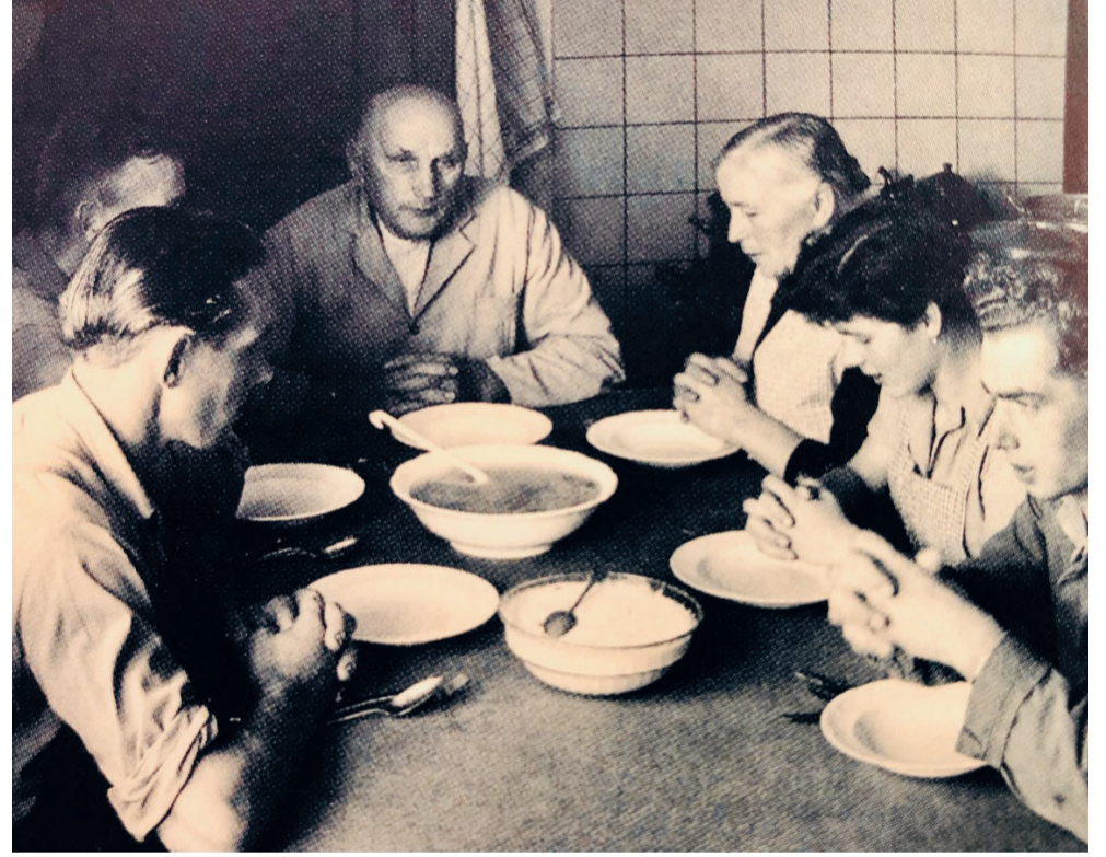
Het boerengezin moest keuzes maken, de meeste kinderen verlieten het ouderlijk bedrijf.